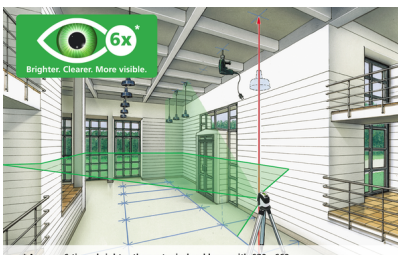
* Approx. 6 times brighter than a typical red laser with 630 - 660 nm