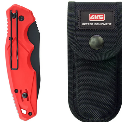
TK 100, holster