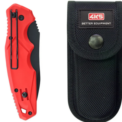
TK 100, étui